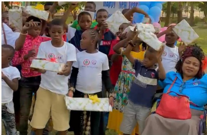
Remise des cadeaux de fin d'année aux orphelins et enfants en situation de handicap de Yaoundé