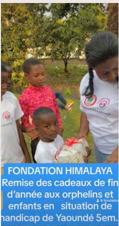
FONDATION HIMALAYA Remise des cadeaux de fin d'année aux orphelins et enfants en situation de handicap de Yaoundé Sem.