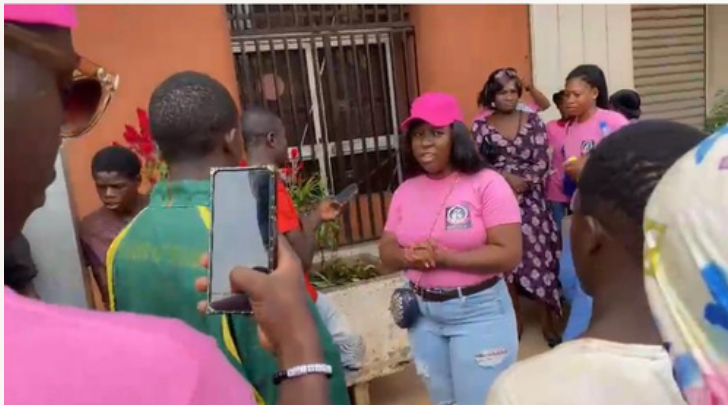
Sensibilisation des enfants de la rue