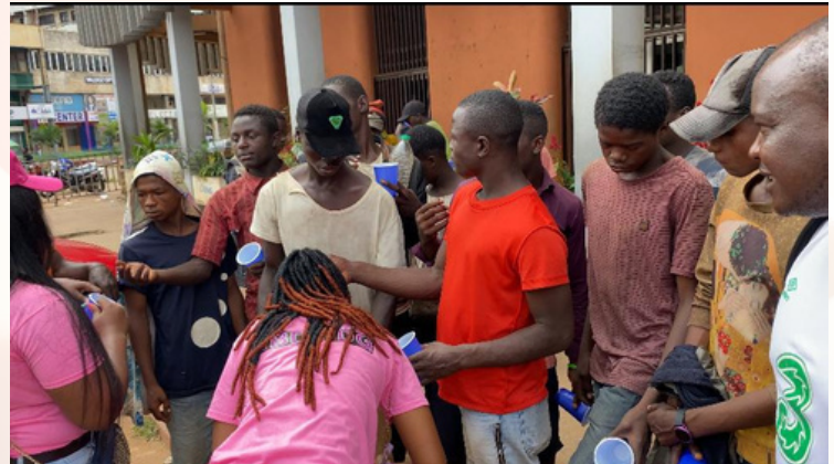
Moments de partage du 06 Novembre 2022